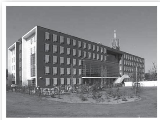
Eddy Hillesum Lyceum, 't Stormink

De meeste leerlingen gaan naar het Eddy Hillesum Lyceum in Deventer of naar het A.O.C. in Twello. Elk jaar is er overleg met de brugklasmentor over de leerlingen die naar het voortgezet onderwijs gaan. En we bespreken dan ook de leerlingen die er al zitten. We willen natuurlijk graag weten of de keuze juist is geweest. We krijgen die informatie van de school voor het voortgezet onderwijs waar de leerling terecht is gekomen.